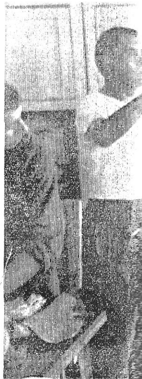
Perin tärkeä varuste laskuvarjohyppäjä, hyppymestari, laskuvarjohyppäjä suoritti