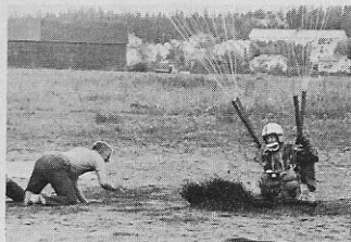
Tarkkuuden kolmas ja tulos 0,01.