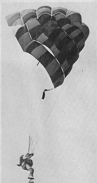
SM-kisoissa ensimmäistä kertaa nähtiin tämäntyyppinen liitovarjo Delta II