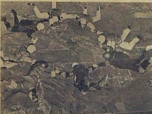
Suomen ennätys, 8-tähti. Suomen Laskuvarjokerhon tekemänä.