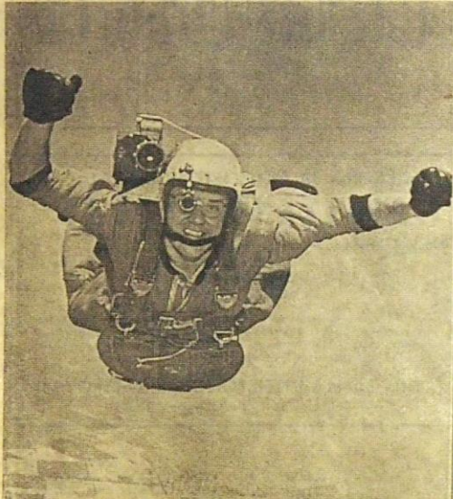
15-miehen tähtiä on tarkoitus filmata kuvassa näkyväellä kypärä- kameralla 15.-22.6. Utissa pidettävällä kansainvälisellä relatiivi- hyppyteillä.

TIEDATTEKO? Etä mistään ette saa hyvää kah- via edullisemmin, kuin meiltä. Pouli kiloa vain 5 pistettä ja sen saatatte saada markalla! Sunnuntaina 16.6.-74 saatte tällä ilmoituksella vapaapelin hallissam- me.