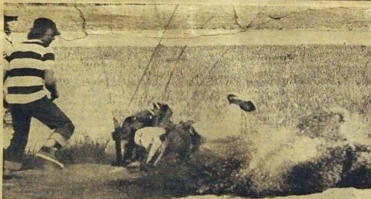
Pehmeälle maalialueelle on turvallista tulla kovemmallakin vauhdilla.

Rautian kanssa rakentaminen sujuu asian- tuntemuksella