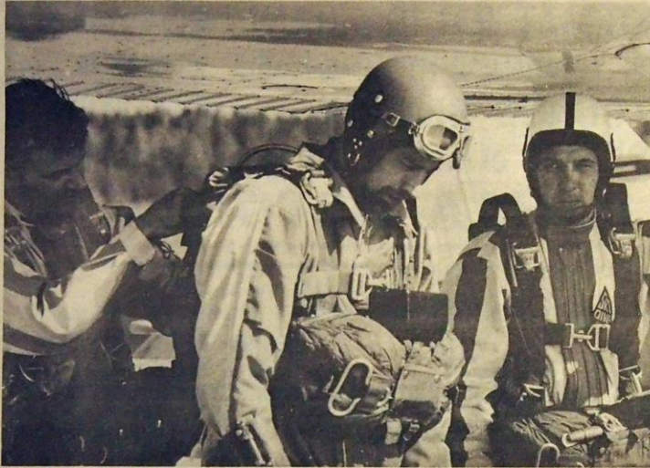
Näytöshyppyyryhmämme valmistautumassa Pyhäntunturin juhannusjuhlien näytöshyppyyn kesällä 1971.