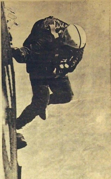
Jalat ulos — mene. Uloshyppyaiikka on määritetty. Pilotille on kerrottu millä "pysäkillä" hyppääjät jäävät pois. Hyppymestari on antanut komentonsa. Vapaapudotus voi alkaa. 12. ensimmäisen sekunnin aikana vauhti kiihtyy n. 200:aan km/h. Tätä putoamisnopeuttaan hyppääjä pystyy kiihdyttämään jopa 350:een km/h. Samanaikaisesti hän voi kulkea myös sivusuuntaan jopa 50 km/h, jos haluaa. Varjo avataan 600 m:n korkeudessa.