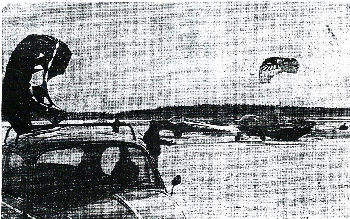
— Laskuvarjohyppäjien hieman dramaattinen maahantulo.