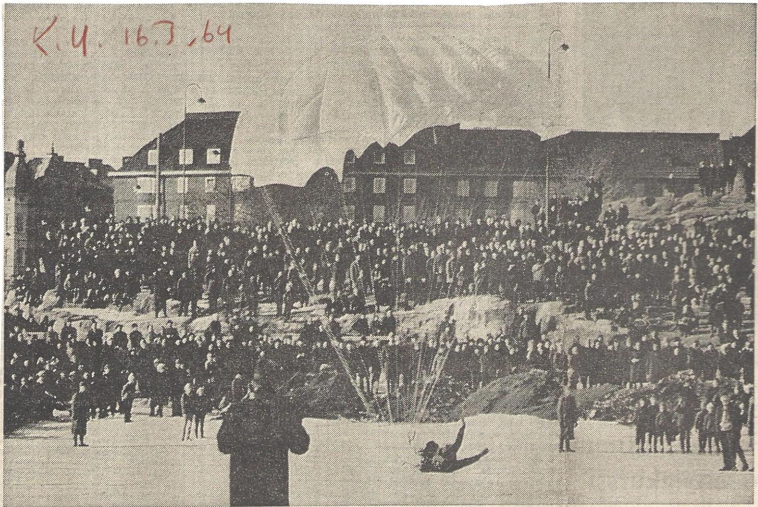
"PELASTUSTOIMINTAA" LASKUVARJOILLA. Suomen Punainen Risti järjesti eilen Helsingissä Kaivopuiston edustalla näytöksen, jossa oli mukana viisihenkinen laskuvarjoensiapuryhmä. Paikalla oli tapahtunut räjähdysonnettomuus, jossa useita ihmisiä loukkaantui vakavasti. Tämä oli lavastettu tilanne, ja laskuvarjoensiapuryhmä saapui Cessna-koneella pelastamaan loukkaantuneita. Laskuvarjoryhmiä on koulutettu suorittamaan pelastustoimintaa vaikeissa olosuhteissa. Helsingissä on kaksi ryhmää ja Kymen läänissä yksi.