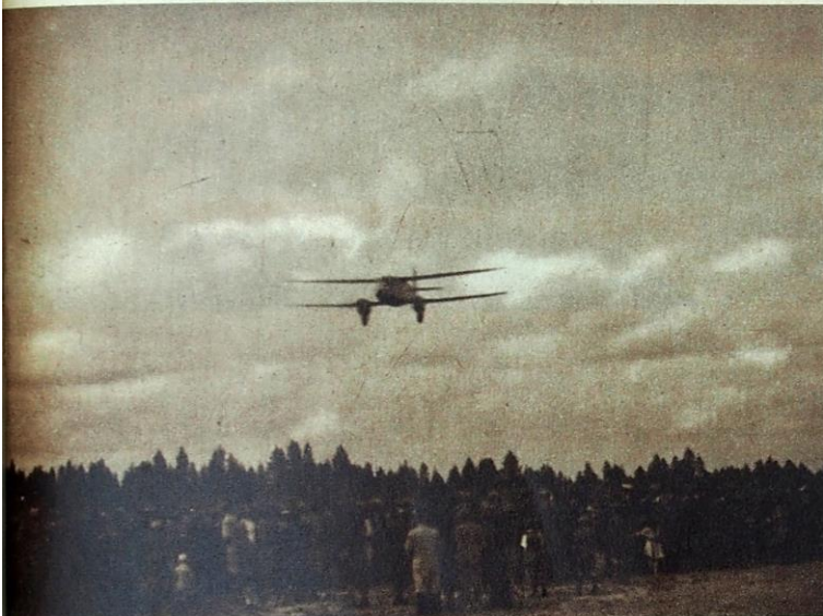
Lentonäytöksissä on jatkuvasti ollut paljon lennätettäviä. Kuorevedelläkin jonotti yli 300 henkeä kärsivällisesti vuoroaan "Salamalla" ja "Lapin" pysähdyspaikalla.

Lauantaina ja sunnuntaina näytettiin Korpi-Elossa invaliidien hyväksi kiinteitä lentoelokuvia. Lennoikki.