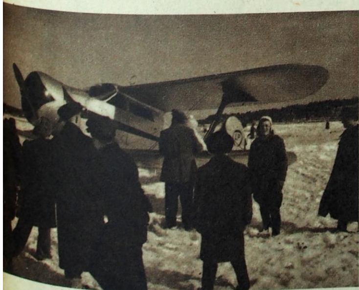
Lentopalvelu OY:n "Kalle-Kustaa" kävi lennättämässä Savonlinnan, Salon ja Lahden lentonäytöksissä.