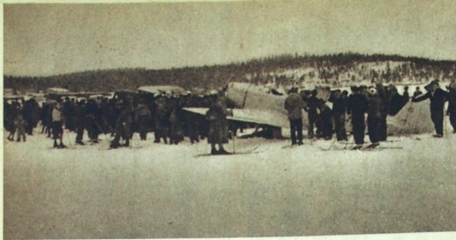
Nurmeksen ja Lieksan näytöksissä oli niinkään hyöä yleisömenestys. Näytösten päätyttyä katselijat jäivät seuraamaan yleisöennätyksiä.

SIL:n kalustolla monipuolinen ohjelma toteutettiin moitteettomasti ja varmaa on, että Pohjois-Karjalassa näytösten jälkeen tiedettiin yhtä ja toista ilmailun alalta. Kerho sai tarvittavat varat uusiin suunnitelmiin ja kansa oli tyytyväinen näkemäänsä. Mitäpä näytöksistä voisikaan enää muuta toivoa.