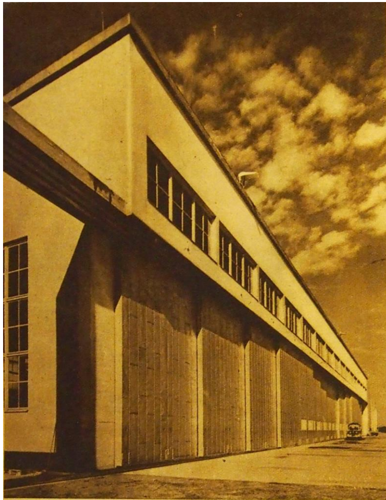
Lentohallin mahtavaa oivirivä Helsingin lentokentällä.