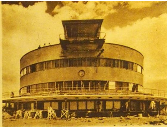
Lentokentän juuri valmistuva hallintorakennus.

L uantaina, t. k. 14 p:nä ovat SILIN, Suomen Ilmapuolustusliiton kansainvälisen ilmailunäyttelyn avajaiset ja sunnuntaina, 15 p:nä, Helsingin komean lentokentän vihkiäiset. Vapausjuhlien aatto vietetään siis pääkaupungissa ilmailun merkeissä.