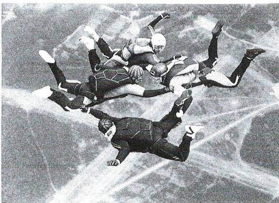
IMPIÄ taivaalta. Harjoittelua Imatralla 1990.