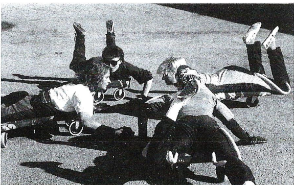
"Lautakuivat" eli kuivaharjoittelua maassa rullalautojen avulla! IMMET asialla. Suomen Laskuvarjokerhosta. Eijan albumista